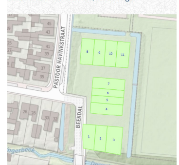
Bouwkavels 'Vierde Veld, Deurningen

- De gemeente heeft bouwgrond aangekocht achter de Veldzijde. Details zijn nog niet bekend.